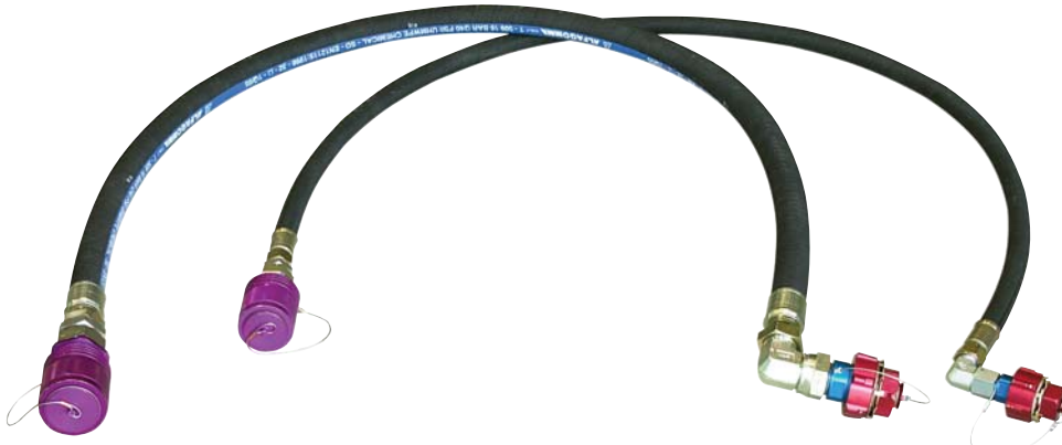
AHK001 - Beispielabbildung

Ein Adapterschlauchsatz (Schlauchlänge 2m) ermöglicht, eine mit einem bestimmten Kupplungssatz ausgestattete HGPU mit einem anderen Flugzeugtyp zu verbinden, ohne dass der Kupplungssatz der HGPU gewechselt werden muss.