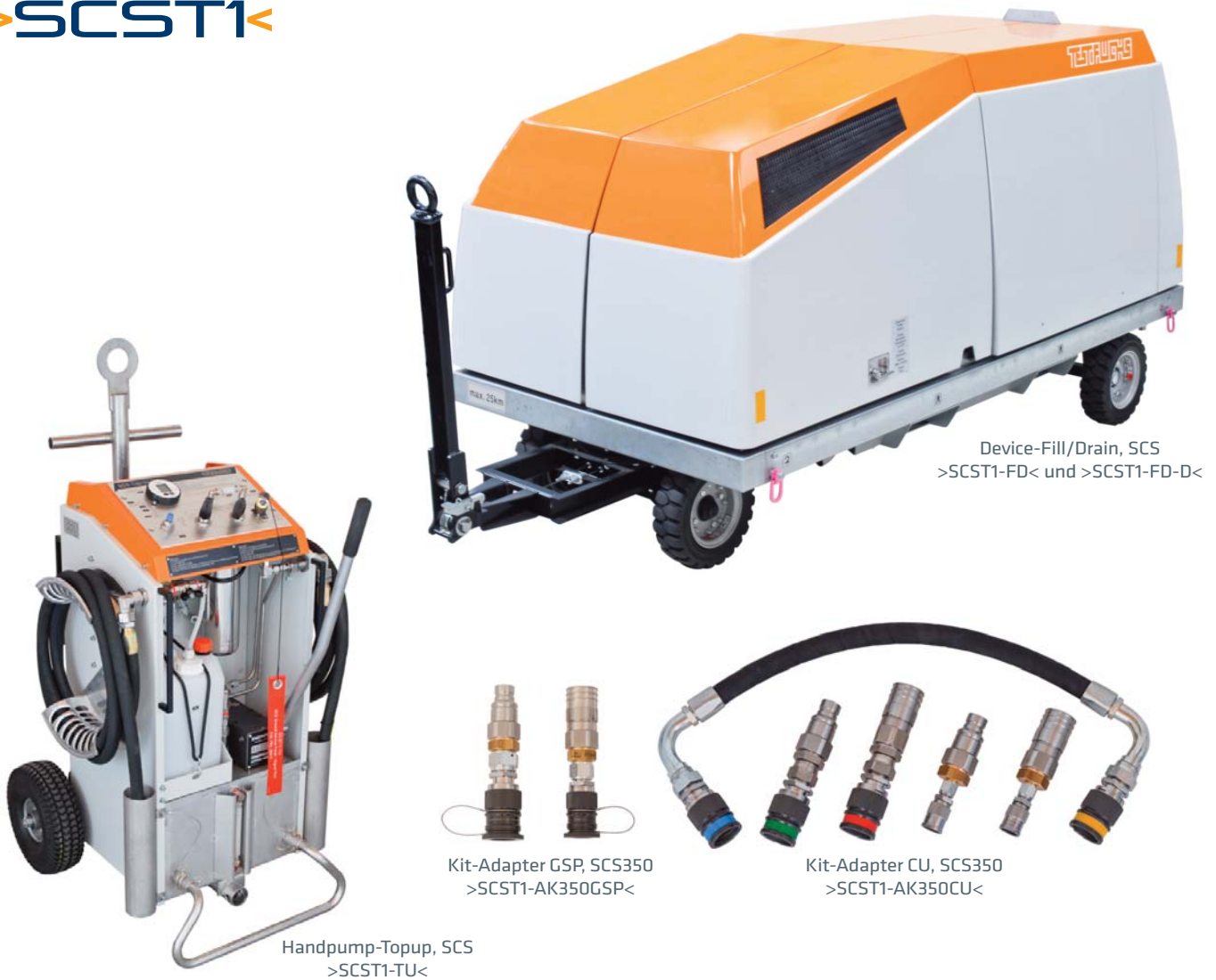
Handpump-Topup, SCS >SCST1-TU<